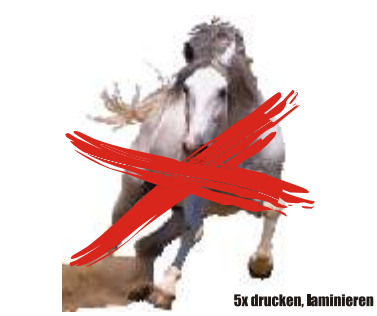
Keine Motivbegrenzung angegeben, Auftragsinformationen im Druckbild / Druckdatei

Auftragsinformationen, wie Stückzahl, Konfektionierung, usw. gehören ebenso wenig in Ihr Motiv. Teilen Sie uns diese bitte in unserem Auftragsformular mit.