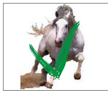
Haarlinie um das Motiv. Die Haarlinie ist zugleich das Referenzmaß, auf das der Druck laut Ihrer Größenangabe in der Bestellung skaliert wird