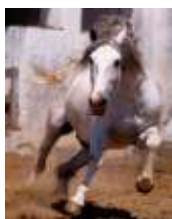
Beispiel 1:72 dpi