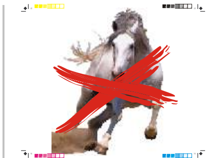
Cutmarks entsprechen nicht dem Endformat, nicht notwendige Densitometerskalen